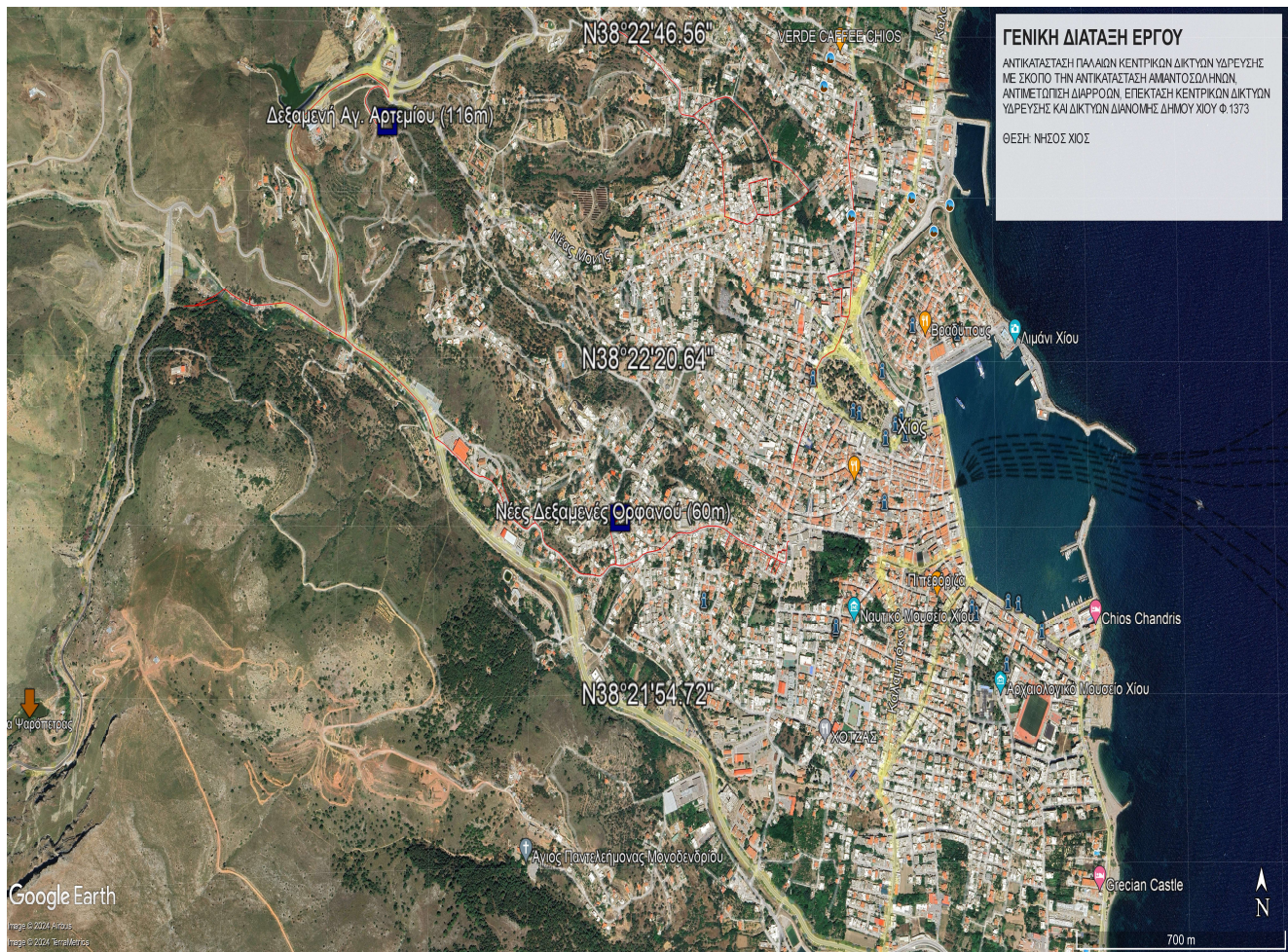
Απόσπασμα Χάρτη GoogleEarthPro: Συντεταγμένες Γενικής Διάταξης Έργου ΕΓΣΑ 87' Κόκκινη γραμμή: Δίκτυα Ύδρευσης